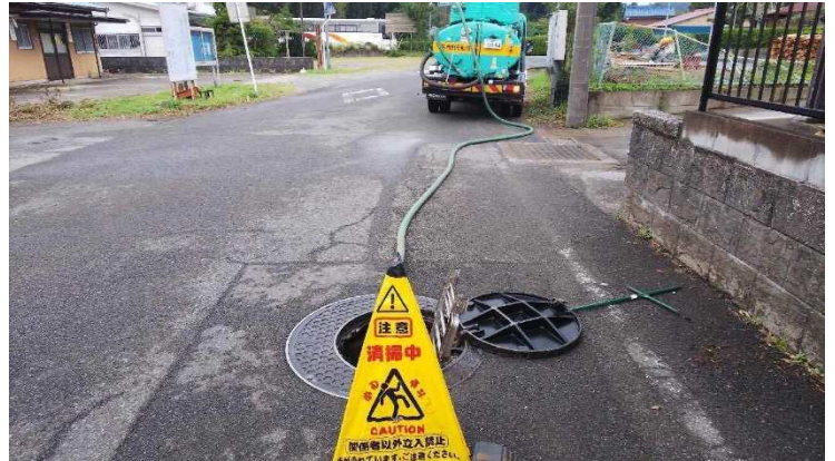
(農業集落排水の輸送の様子)